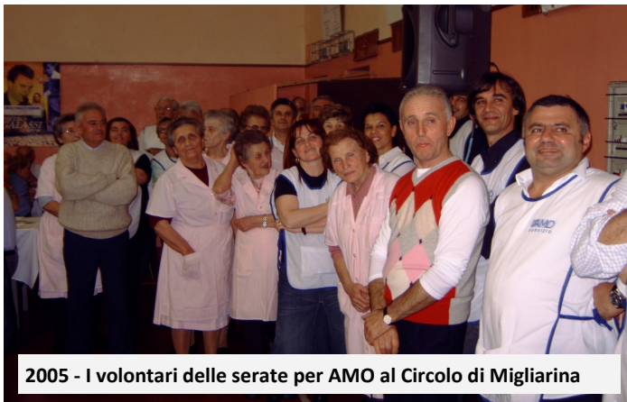
2005 - I volontari delle serate per AMO al Circolo di Migliarina