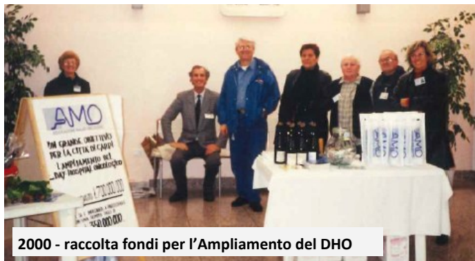
2000 - raccolta fondi per l'Ampliamento del DHO