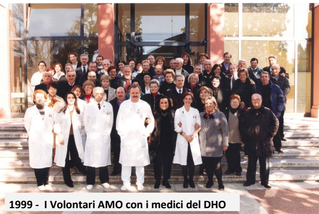
1999 - I Volontari AMO con i medici del DHO