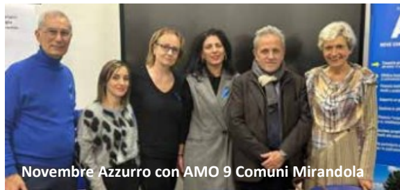
Novembre Azzurro con AMO 9 Comuni Mirandola

so a disposizione da AMO in convenzione AUSL. Senza manuale come è stato possibile tutto questo? "Un miracolo" e tanta dedizione e passione. La stessa passione che nel 1996 fece nascere AMO Carpi (Associazione Malati Oncologici) e nel 2004 AMO Nove Comuni Area Nord a Mirandola. Non solo associazioni, ma un grande abbraccio per coloro che hanno bisogno. Di pari passo cresceva la realtà di Mirandola in spazi, tecnologie e personale (10 persone fra medici, infermiere e coordinatrice, OSS); grazie anche all'aiuto di AMO NOVE COMUNI, che si è impegnata in tutti questi anni a sostenere il DHO mirandolese, i trasporti dei pazienti e l'assistenza sul territorio con volontari e personale in convenzione AUSL. Fra le tante iniziative, mi piace segnalare il servizio trasfusioni a domicilio, iniziato nel 2011 per malati oncologici, dal 2012 esteso a tutti i pazienti, svolto da volontari: un modello, per le sue caratteristiche, nella Provincia di Modena. Un grazie di cuore a tutti i volontari delle due Associazioni, per quello che fanno, con gratuità e spirito di amore per il prossimo.