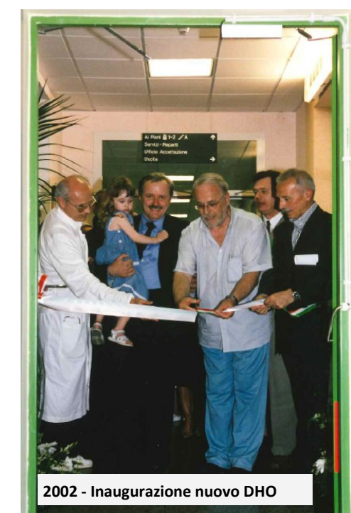
2002 - Inaugurazione nuovo DHO