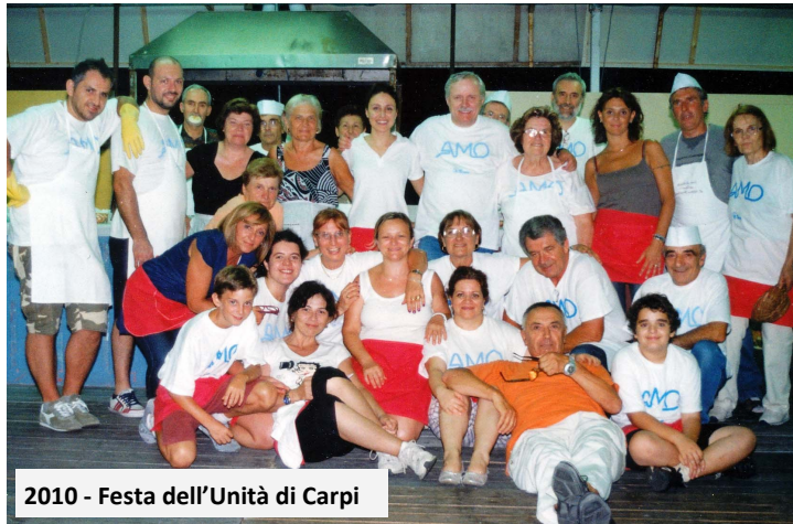
2010 - Festa dell'Unità di Carpi