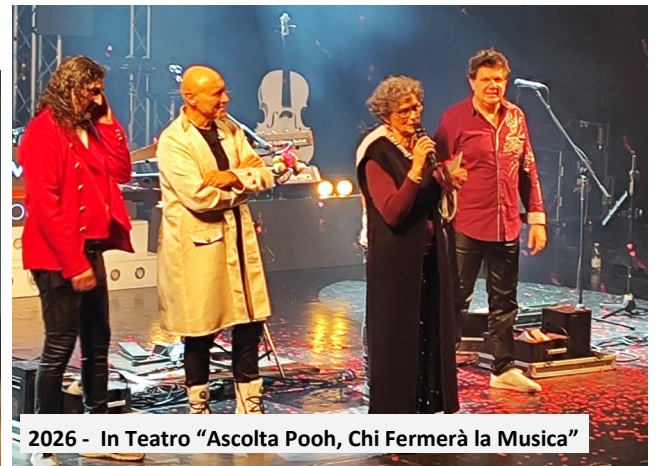
2026 - In Teatro "Ascolta Pooh, Chi Fermerà la Musica"