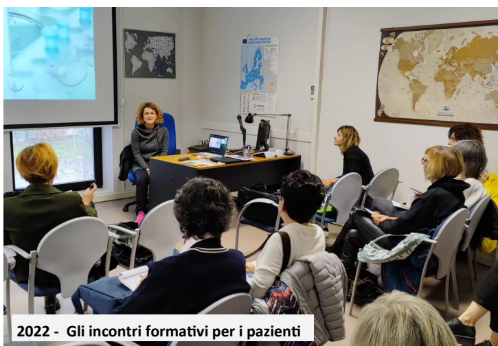
2022 - Gli incontri formativi per i pazienti