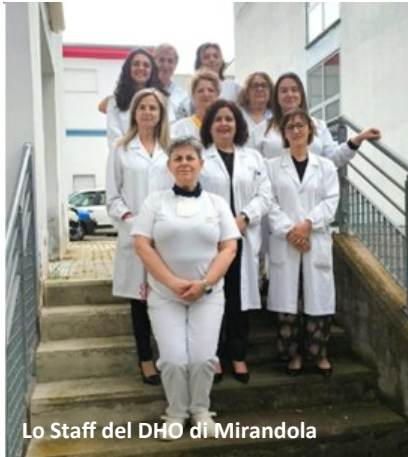
Lo Staff del DHO di Mirandola