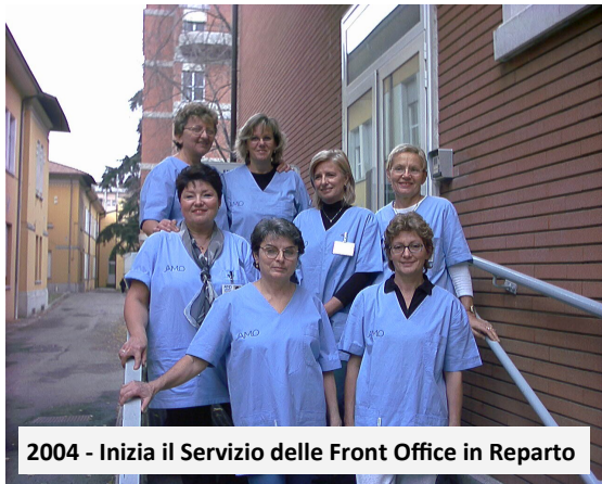
2004 - Inizia il Servizio delle Front Office in Reparto