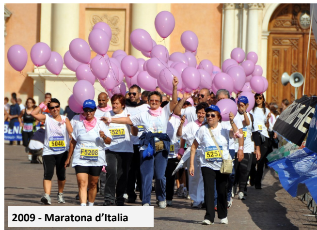
2009 - Maratona d'Italia