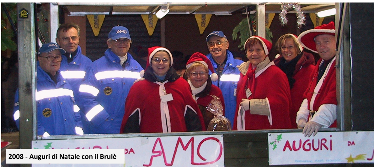
2008 - Auguri di Natale con il Brulé