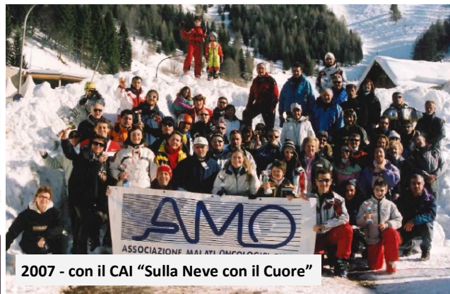
2007 - con il CAI "Sulla Neve con il Cuore"