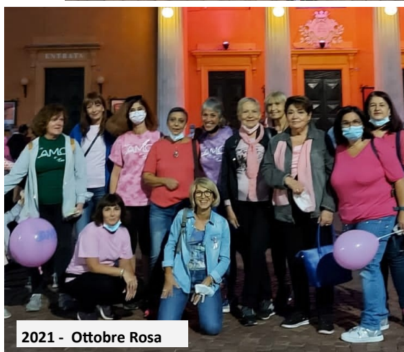
2021 - Ottobre Rosa