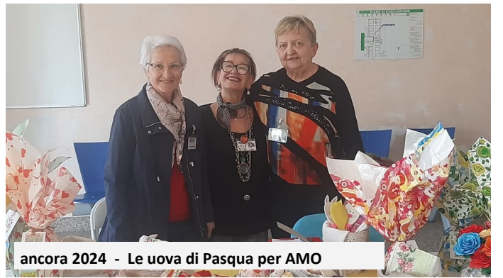
ancora 2024 - Le uova di Pasqua per AMO