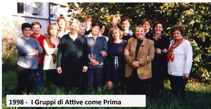
1998 - I Gruppi di Attive come Prima