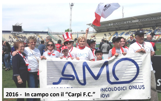
2016 - In campo con il "Carpi F.C."