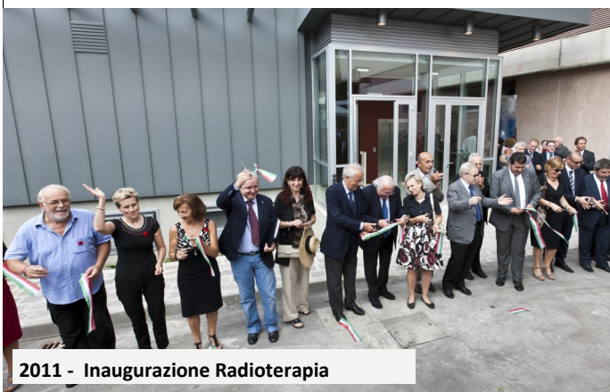
2011 - Inaugurazione Radioterapia