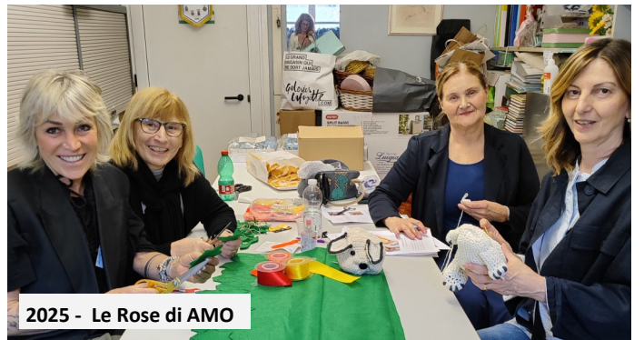
2025 - Le Rose di AMO