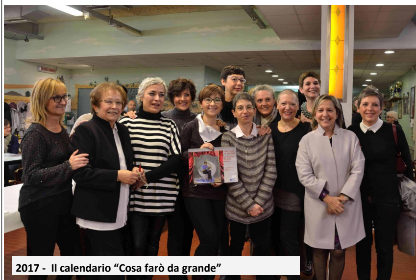
2017 - Il calendario "Cosa farò da grande"