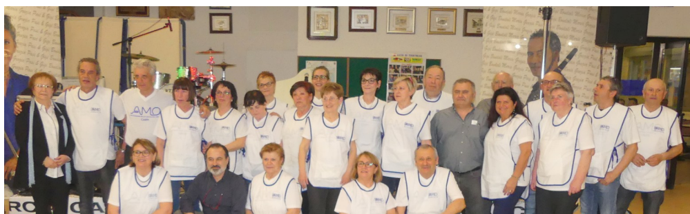
2019 - Le serate con i volontari a Budrione