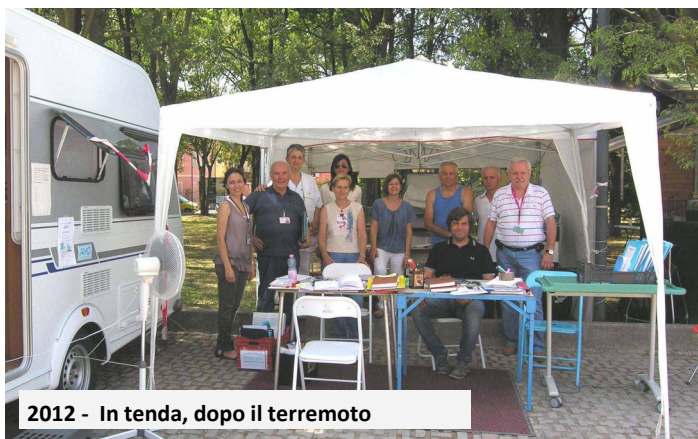
2012 - In tenda, dopo il terremoto