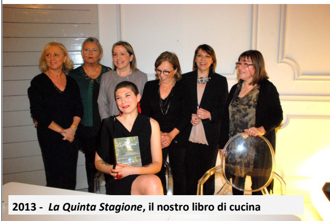
2013 - La Quinta Stagione, il nostro libro di cucina