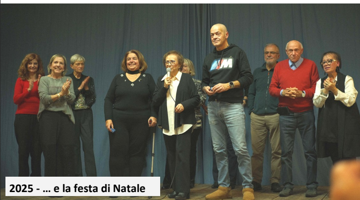
2025 - ... e la festa di Natale