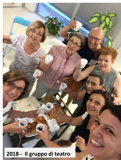
2018 - Il gruppo di teatro