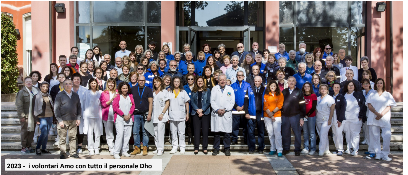
2023 - i volontari Amo con tutto il personale Dho