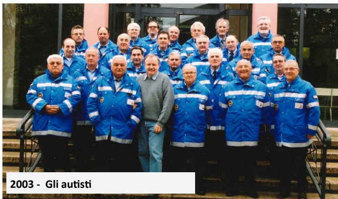
2003 - Gli autisti