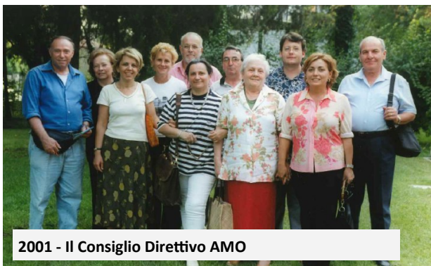
2001 - Il Consiglio Direttivo AMO