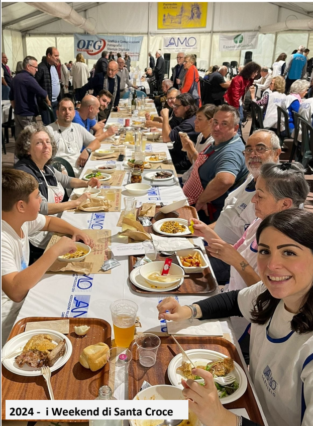
2024 - i Weekend di Santa Croce