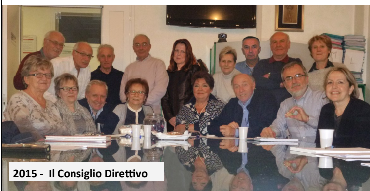
2015 - Il Consiglio Direttivo