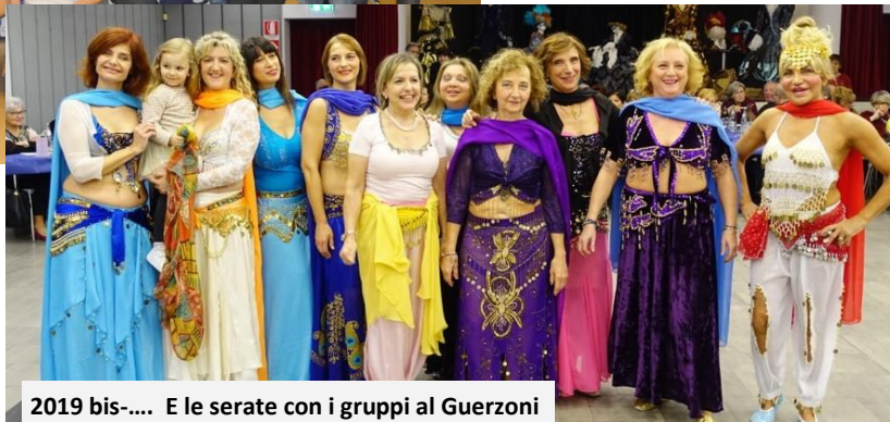
2019 bis-.... E le serate con i gruppi al Guerzoni