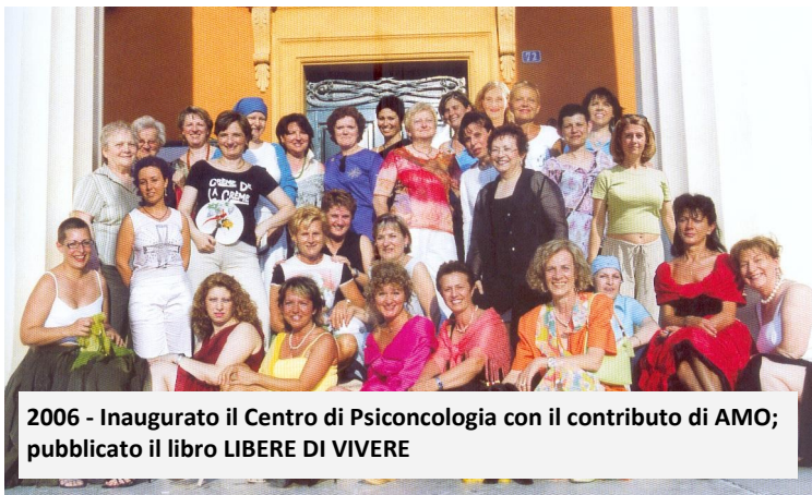
2006 - Inaugurato il Centro di Psiconcologia con il contributo di AMO; pubblicato il libro LIBERE DI VIVERE